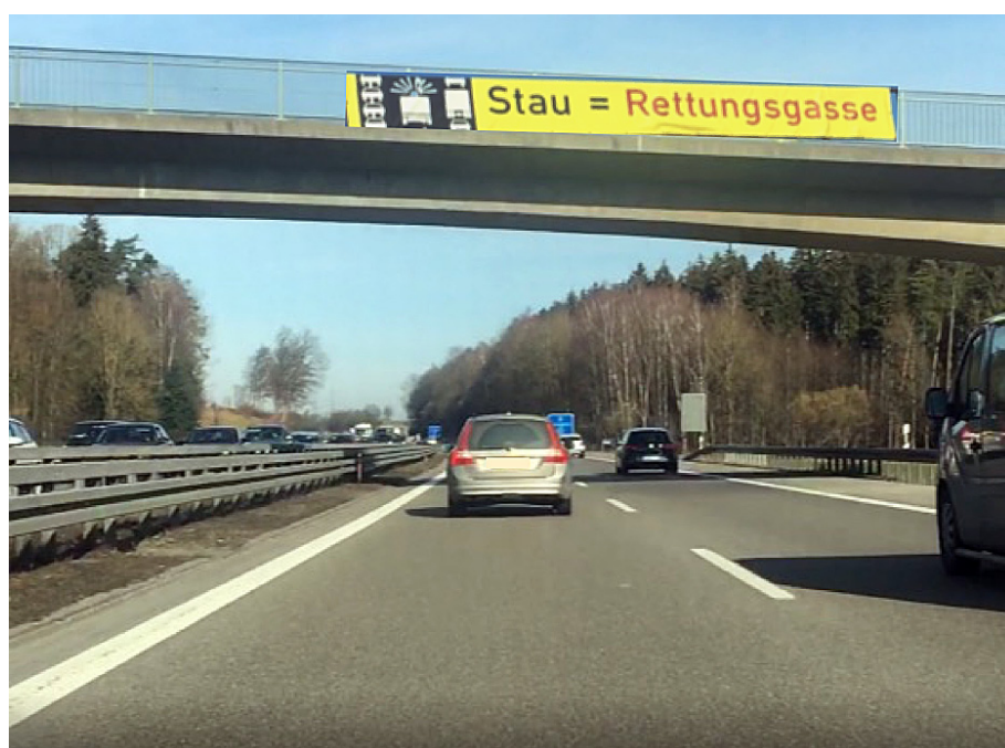
Figur 1. Eksempel på informationskampagne til trafikanterne på de tyske motorveje om etablering af redningsspor ("rettungsgasse") ved udrykning i tæt trafik/kø. Her fra A7 i februar 2019.

stopper op, nogle kører delvist ud i nødsporet, mens andre igen nærmest holder på tværs. Én dag passerer udrykningen midt på vejen mellem trafikanterne, en anden dag kommer beredskabet susende med blink og udrykning, men denne gang i nødsporet. I bund og grund er det ikke så mærkeligt, hvis vi som trafikanter kan være lidt usikre på, hvor vi kan forvente, at udrykningskøretøjerne passerer forbi os, og hvordan vi skal forholde os.