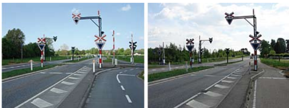
Figur 2. En af de moderniserede jernbaneoverkørsler.

I 1996 og 1997 blev der konstateret nogle