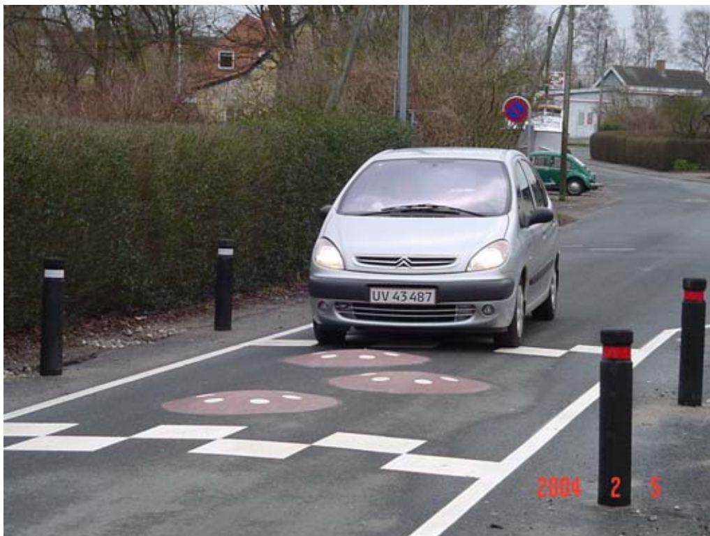
Figur 5.1: Pukkelbump i Skuldelev

Der er i de senere år udført forsøg med etablering af pukkelbump (mushrooms) i flere danske kommuner. Ideen med pukkelbump er at de skal virke på personbilerne uden samtidigt at genere buschaufførerne. Det gøres ved at placere puklerne i et mønster på tværs af vejen, så store køjetøjer pga. sporvidden kan passere bumpene med et hjulpar på hver side af puklen uden at køre op over dem, mens personbilerne har mindst et hjulpar oppe på puklen.