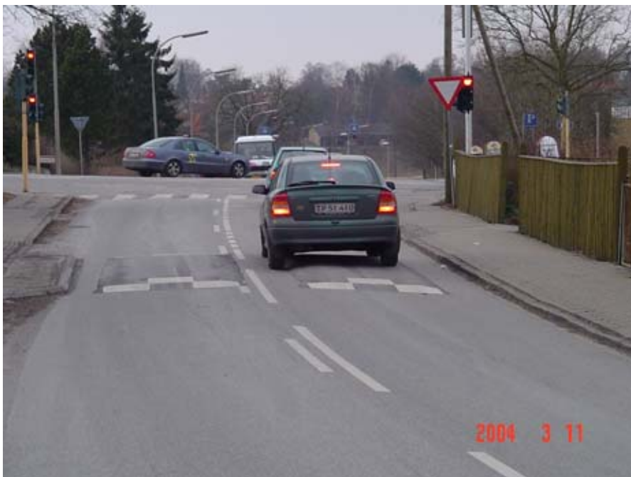
Figur 4.3: Pudebump i Birkerød.