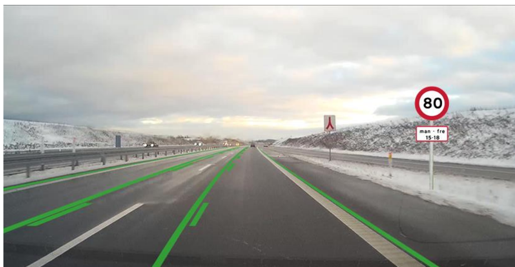
Figur 3.5 Midlertidig hastighedsbegrænsning vist sammen med grønne vognbanelinjer/spærrelinjer og hvide vognbanelinjer.

Til denne visning (se figur 3.5) er der stillet 3 spørgsmål.