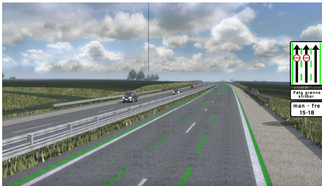
Figur 3.1. Skiltet tidsbegrænset brug af de grønne vognbanelinjer

Til denne visning (se figur 3.1) er der stillet 3 spørgsmål.