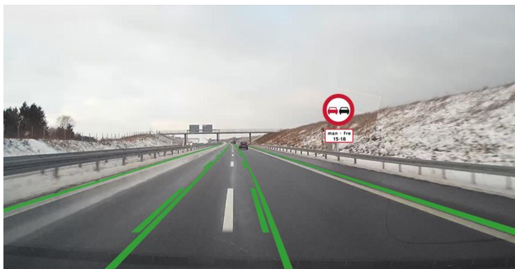
Figur 3.3. Tidsbegrænset overhalingsforbud vist sammen med grønne vognbanelinjer/spærrelinjer og hvide vognbanelinjer.

Til denne visning (se figur 3.3) er der stillet 3 spørgsmål.