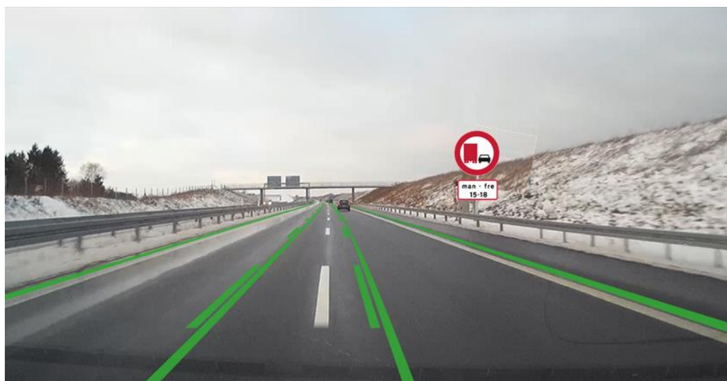
Figur 3.4. Tidsbegrænset overhalingsforbud for lastbiler vist sammen med grønne vognbanelinjer/ spærrelinjer og hvide vognbanelinjer.

Til denne visning (se figur 3.4) er der stillet 3 spørgsmål.