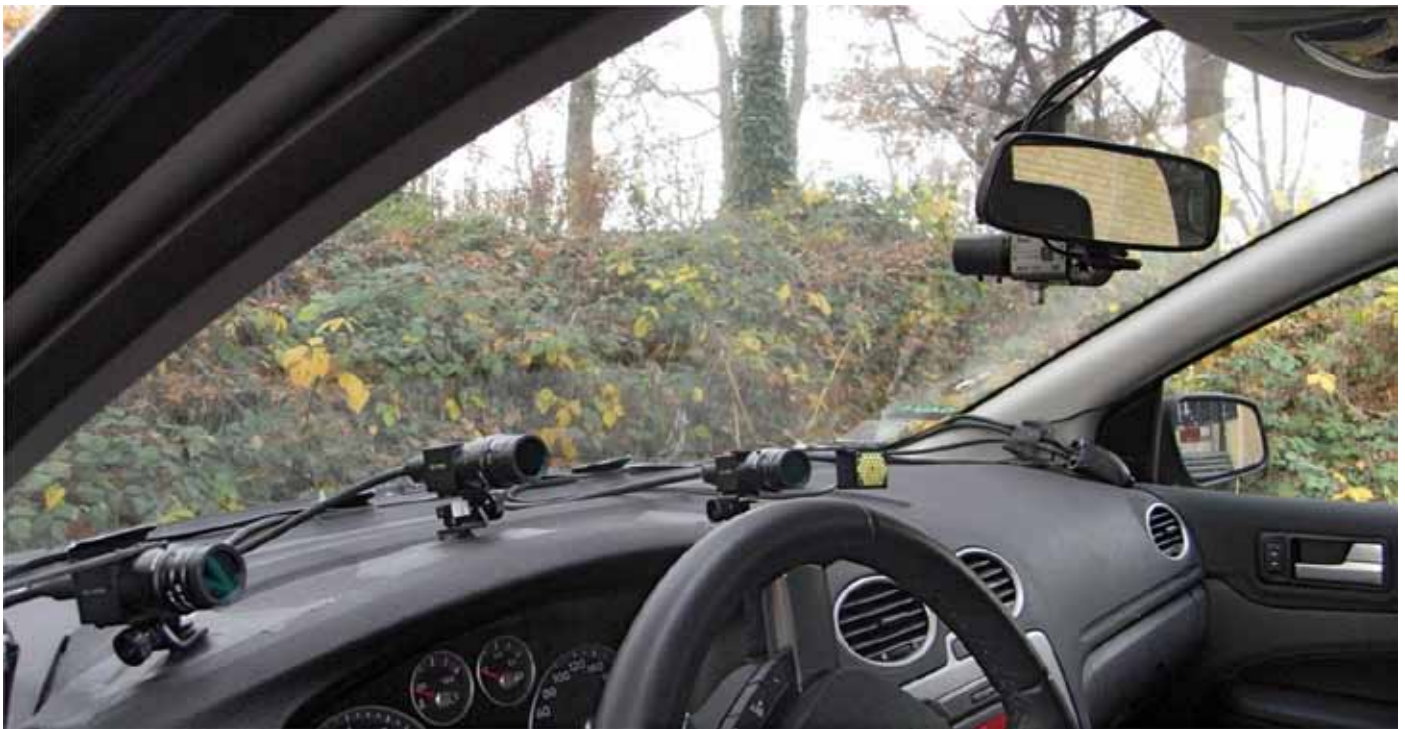
Figur 2. Målebilen er udstyret med et eyetracking system, der under kørslen registrerer, hvad bilistens blik er rettet mod. Udstyret består bl.a. af tre små infrarøde kameraer placeret på instrumentbrættet samt et scenekamera, der videofilmer ud af forruden.

ringsprogram, som bestående af fire dele: