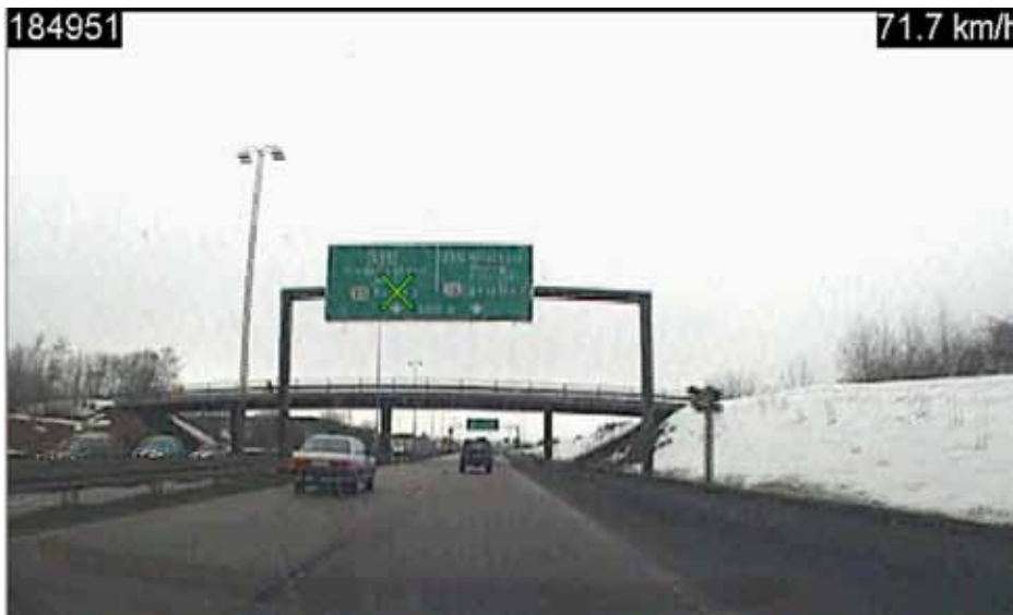
Figur 3. Det grønne kryds på portaltavlen angiver det sted, testbilistens visuelle fokus er rettet mod – her S5 på forgreningsstrækningen. Tallet i øverste venstre hjørne refererer til data i en tilhørende logfil. Tallet øverst til højre i billedet angiver bilistens aktuelle hastighed, som registreres vha. GPS.

korte blik (< 0,4 sek.) og flere lange blik (>2,0 sek.) mod tavlerne end de unge. Det skal bemærkes, at testbilisternes gennemsnitlige samlede læsetid kun overstiger den beregnede (teoretiske) læsetid i relation til én af de syv vejvisningstavler (S2), se tabel 1. Resultatet giver anledning til at genoverveje definitionen for en information i læsetidsformlen: T=(N/3+2) sek., hvor N er antallet af informationer.