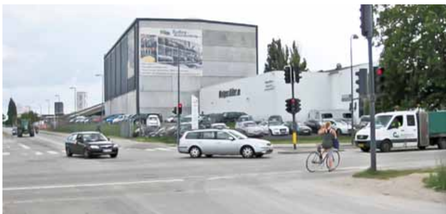
Figur 2. Signalreguleret T-kryds med ind-/udkørsel. Tvivlsomme vigepligtsregler for den venstresvingende cyklist, der holder i en afmærket venstresvingsbås på cykelstien.

ter og motorkøretøjer inden for fastlagte observationsområder. I disse områder kunne der reelt indgå konflikter med højre- eller venstresvingende motorkøretøjer eller motorkøretøjer, der kører op på cykelstien. Der er registreret 14 konflikter mellem højresvingende biler og bløde trafikanter, heraf 12 alvorlige. 9 af de 14 konflikter sker i to kryds, hvor der er højresvingspil for bilister. Af de 9 konflikter sker 8 i de forholdsvis korte tidsrum, hvor højresvingspilen slukkes, og hovedsignalet skifter fra rødt til grønt. I det ene kryds er der ingen mellemtid mellem slukning af grøn højresvingspil og hovedsignallets skifte fra rødt til rødt/gult i de registrerede konflikter, mens der i det andet kryds er 0-4 sekunders mellemtid. Det er derfor rimeligt at sige, at højresvingspil for bilister forud for grønt hovedsignal kan være problematisk.