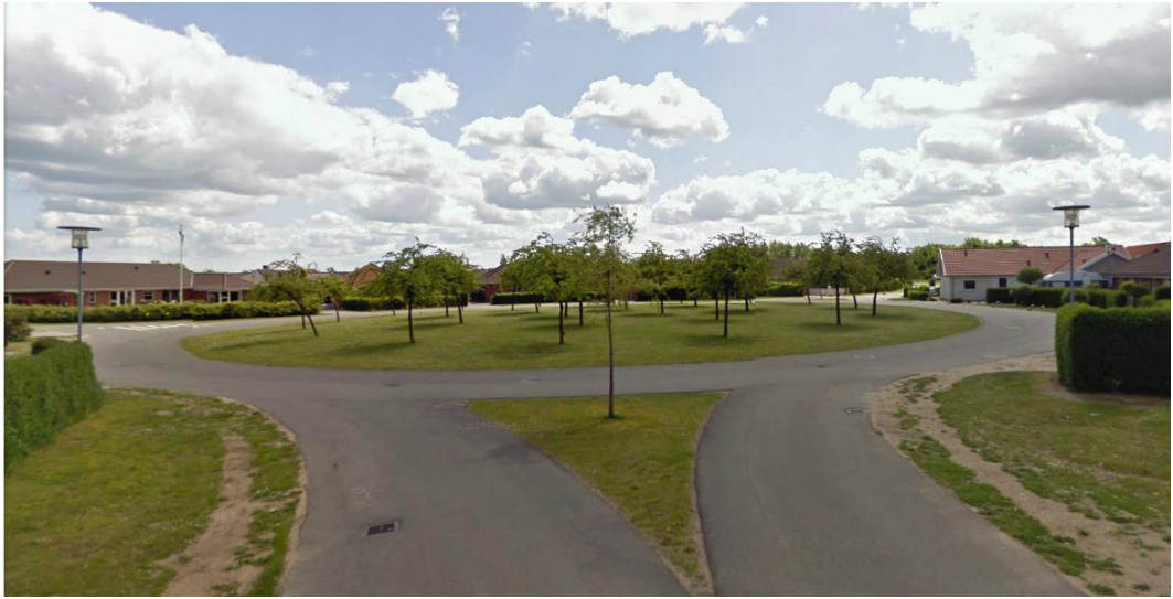
Figur 1. Et rundkørselslignende færdselsareal, men det er ikke en rundkørsel.

I Danmark er ensretningen i minirundkørsler, hvor midterøen er overkørbar, afmærket med påbudstavle D12 ved vigelinjen. Ensretningen afmærkes med påbudstavle D11.3 på den ikke overkørbare midterø i andre rundkørsler.