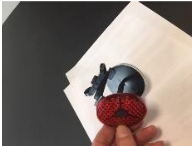
Figur 1: Refleksbrik som kan fastspændes i autoværn. Bemærk, at der anvendes hvid refleksfarve i vejmidte.

På motorveje er det forsøgt at erstatte kantpæle i midteradskillelsen med refleksbrikker fastspændt i siden af autoværnet på strækninger, hvor autoværn er placeret langs belægningskanten, dvs. typisk på ensidigt autoværn. I erfaringskataloget Kantafmærkning i midterrabat på motorvej (Vejdirektoratet, 2019) angives, at der regnes med tre enkeltmonterede reflekser pr. 100 m. Refleksarealet på refleksbrikkerne varierer mellem ca. 3.000 mm 2 og ca. 4.800 mm 2 afhængig af type (eksempel ses i Figur 1).