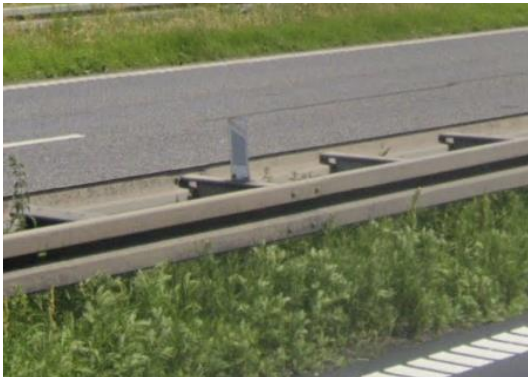
Figur 2: Flapkantpæl i aluminium påsat en tværbjælke i et dobbeltsidet autoværn.

sættes på enkeltsidet autoværn. Stykprisen er lavere, men til gengæld skal der benyttes én pr. køreretning.