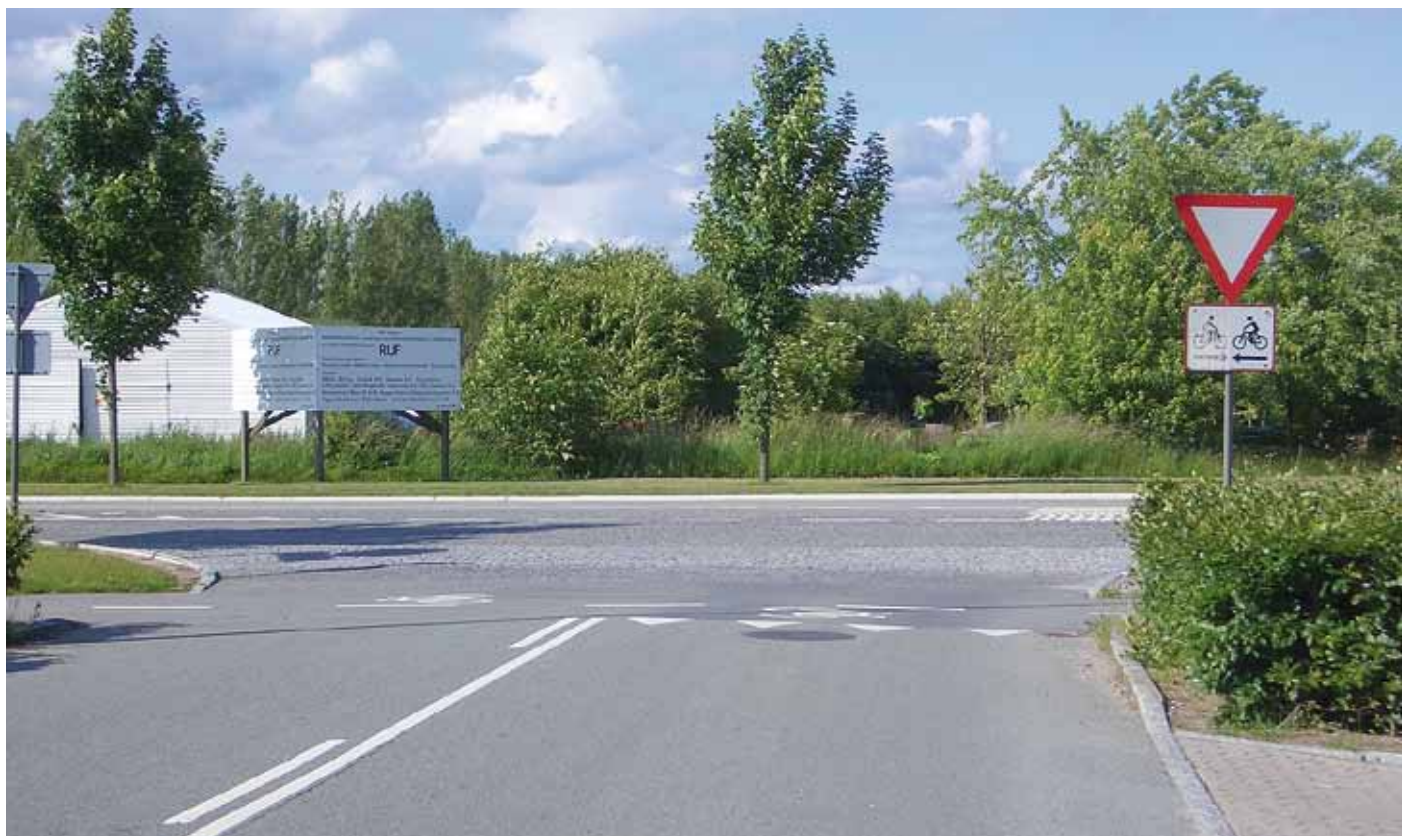
Figur 3. Mindre kryds med vigepligt ved vej-stikryds og overkørsel ved vej-vejkryds.