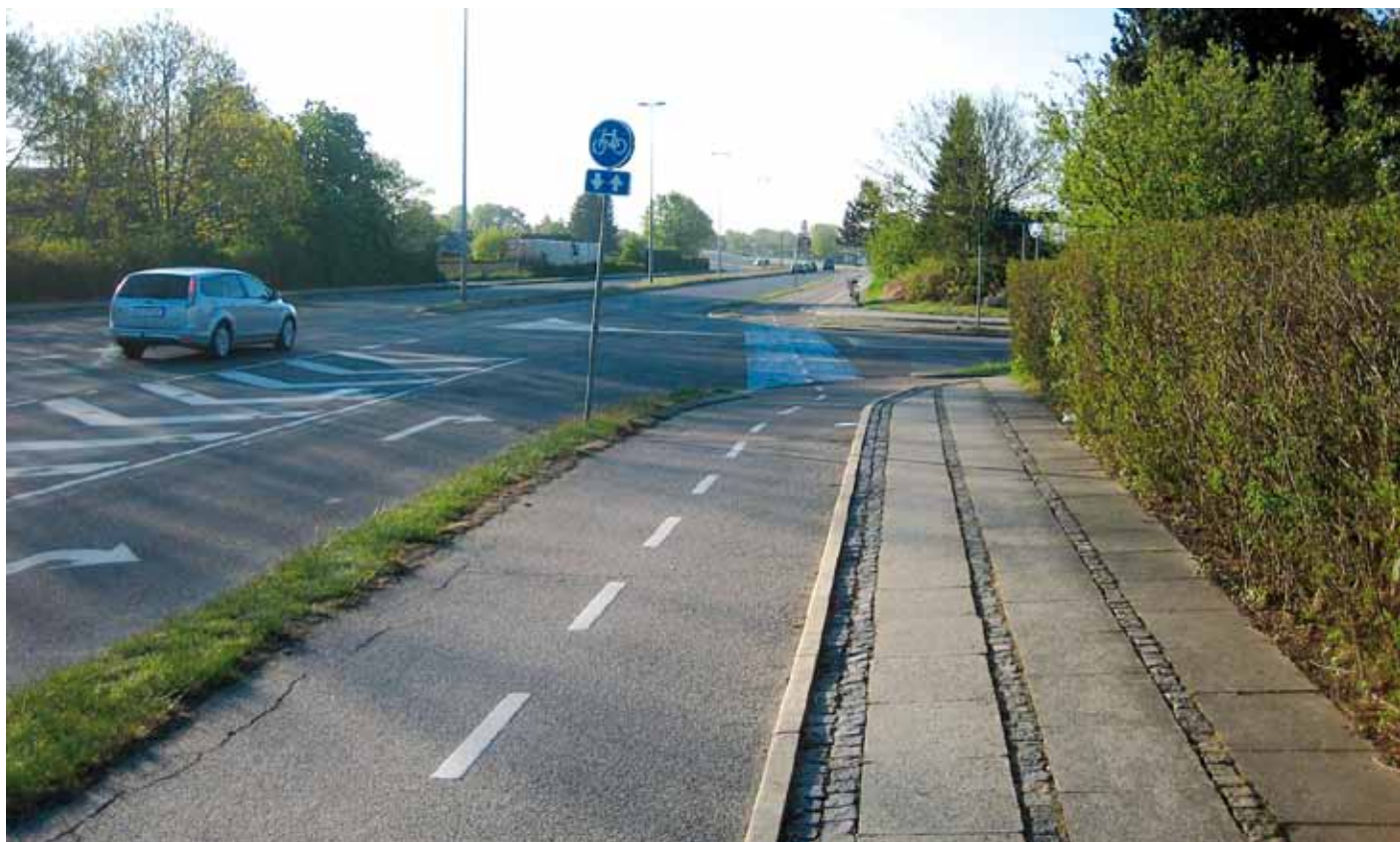
Figur 1. Stort kryds med kanalisering og blåt cykelfelt.

ter på stien samt ÅDT for indkørende trafik i vej-vejkrydset. De fire designvariable omhandler tilstedeværelse af midtlinje på sti gennem kryds, skiltning af vigepligtsforhold, tilstedeværelse af farvet (blåt eller rødt) cykelfelt gennem kryds samt vigepligtsforholdene. Det er vigtigt at have for øje, at en designparameter kan vise sig at være signifikant, fordi den er korreleret med en trafikmængde, der ikke indgår i modellen. Ligeledes kan designparametre have betydning for antallet af ulykker, selvom de ikke er med i modellen. Langt flere parametre end førnævnte fire f.eks. oversigtsforhold, afstand mellem vej og sti, zone og hastighed er testet, men har ikke været signifikante.