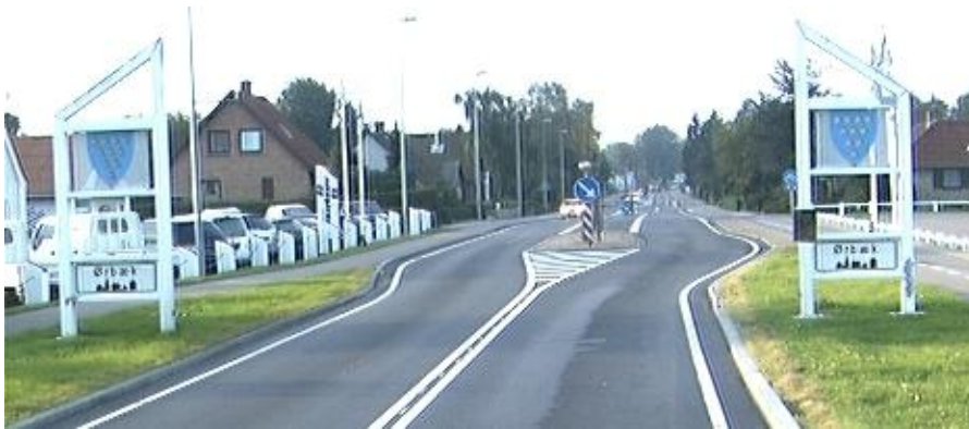
Fysisk/visuel byport ved Ørbæk på Fyn.

Byporte med en kombination af fysiske og visuelle foranstaltninger er den eneste af de tre typer, som samlet set peger i retning af et fald i personskadeuheld og et fald i personskader. Samlet resulterer de fysiske/visuelle byporte i en reduktion i personskadeuheld på 28% og en reduktion i personskader på 15%. Ingen af ændringerne er dog signifikante. Der findes en svag tendens til en stigning i materielskadeuheld på 36%.