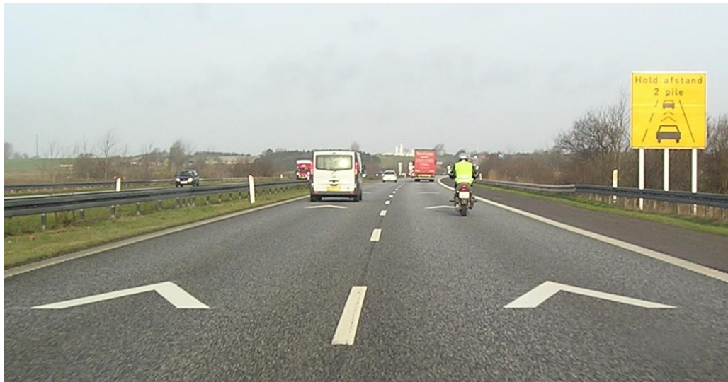
Foto fra motorvejsstrækning med afstandsmærker.

400 meter før strækningen med afstandsmærker begynder, er der i begge sider af kørebanen opstillet advarselstavler med en undertavle. Undertavlen informerer om forsøg med afmærkning. På selve strækningen med afstandsmærker er der opstillet et gult informationskilt i højre vejside, der informerer om mærkernes funktion (se nedenstående foto fra strækning med informationskilt). Skiltet findes to gange på selve strækningen. Ved etableringen af de fem nye strækninger med afstandsmærker i 2007, har Vejdirektoratet endvidere informeret trafikanter og borgere om projektet via pressemeddelelser og på trafikken.dk.